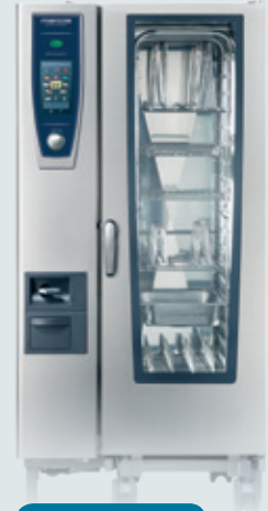
Metos SELFCOOKINGCENTER 201