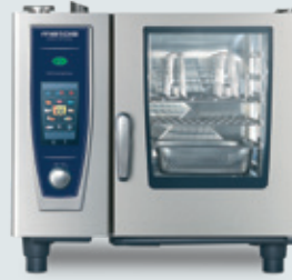
Metos SELFCOOKINGCENTER 61