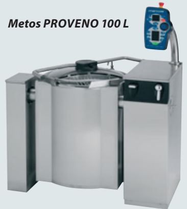
Metos PROVENO 100 L