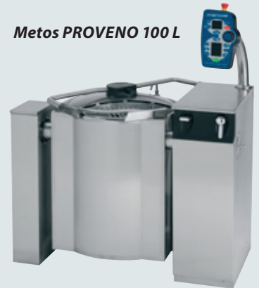
Metos PROVENO 100 L