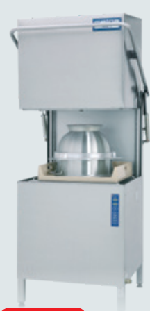
Metos WD-7 AUTOSTART ASTIANPESUKONE