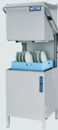
Metos WD-6 ASTIANPESUKONE