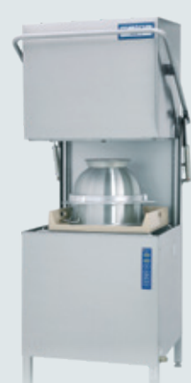
Metos WD-7 AUTOSTART ASTIANPESUKONE