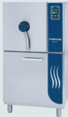
Metos MARVEL E1 PAINKEITTOKAAPPI