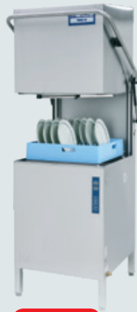
Metos WD-6 ASTIANPESUKONE