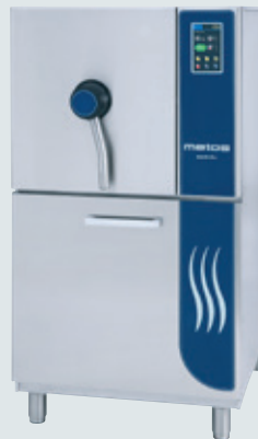
Metos MARVEL E1 PAINAKEITTOKAAPPI